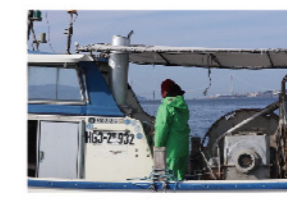
底曳き会有志チーム

駒ケ林で、しらす漁や潜水器漁を行なっています。ナマコやアワビ等、旬の魚介類を販売予定です！